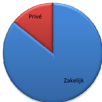
Nieuwverkoop per type eigenaar