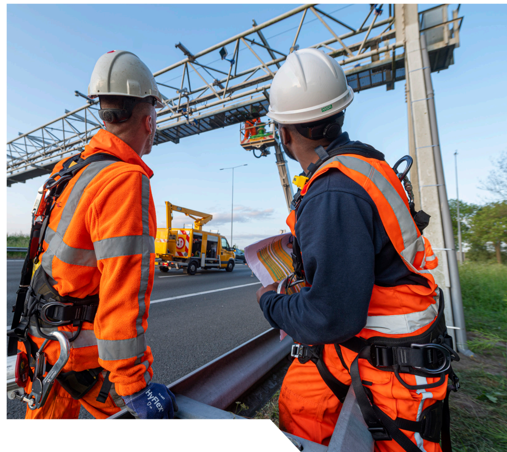
Bouw van de proefopstelling op de A12 van de apparatuur voor kentekenerkenning die straks gebruikt gaat worden voor tolheffing op de Blankenburgverbinding/A24.

Daarnaast werken we mee aan het ontwikkelen van internationale regelgeving. 'De regelgeving voor de voertuigbranche wordt voornamelijk buiten Nederland bedacht, in EU- en UNECE-verband', zegt Jantina. 'We moeten daarom goed opletten wat er over de grens gebeurt. We zitten aan tafel om het belang van de Nederlandse samenleving te dienen, want uiteindelijk moeten we wet- en regelgeving hier uitvoeren en moet het ons in Nederland